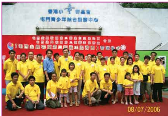
8-7-2006 義工誓師儀式 義工大合照

如有任何查詢，請致電2465-2233或傳真2465-1199與屯門大興花園第二期管理處胡小姐聯絡。