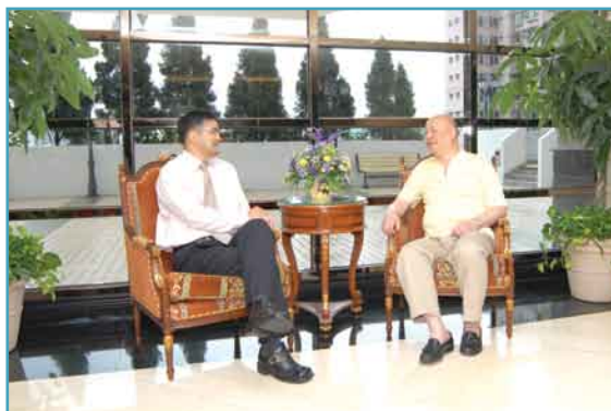
陳主席(右) 暢談管理感受

大寶閣的住客均是商界翹楚，日理萬機，屋苑內的各項康樂設施可提供多渠道舒緩各住客的工作壓力，因此，業主法團過往積極推動私人教授各項康樂活動，藉此加強住客對強身健體的重要信息。