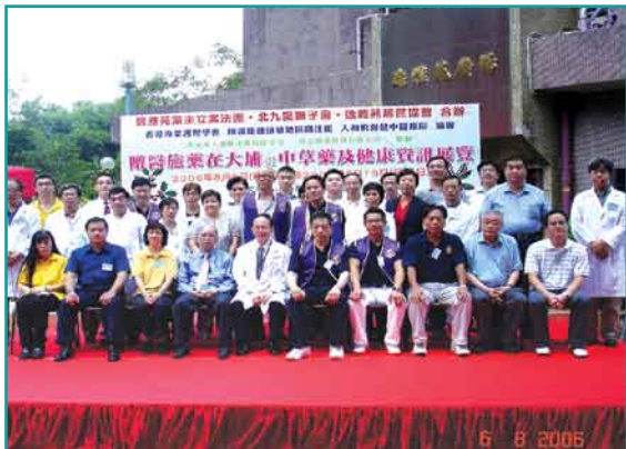
「贈醫施藥在大埔 暨 中草藥及健康資訊展覽」各位嘉賓、中醫師及義工大合照