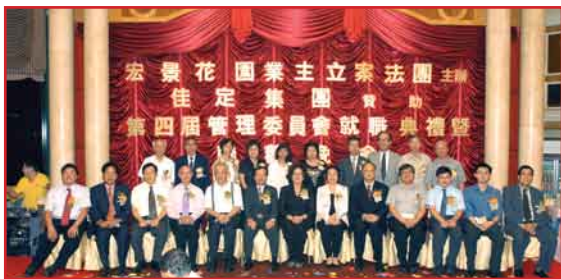
第4屆管理委員會委員與各主禮嘉賓合照留念。

晚宴上，大會亦準備了一連串的精彩節目助慶，包括幸運大抽獎、嘉賓獻唱、屋苑孩童表演跆拳道及居民歌舞表演等，聯歡晚會在一片歡樂氣氛下完滿結束。