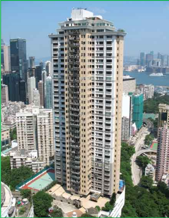
大寶閣 Trafalgar Court