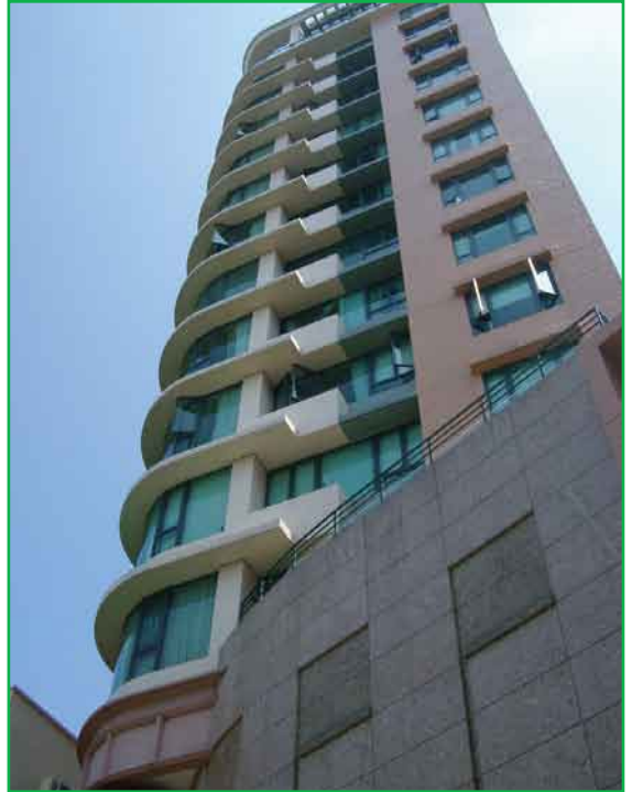
怡晴軒 Scenic Lodge

士趨之若鶩之選，此類買家在選購物業時非常嚴謹，無論地點、景觀、交通及配套均要求極高。為了滿足尊貴住客的要求，各大管理公司相繼推行星級酒店般的豪宅管理服務。服務員均須接受專業酒店式的管理訓練，致力為住客提供無微不至的貼身服務。