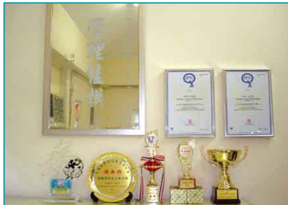
榮獲的眾多獎項證明管理的專業