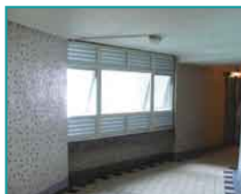
樓層大堂原設計對住戶及升降機構成影響 完成「防風雨鋁窗加裝工程」後可獲明顯改善