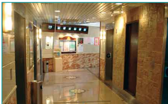
大堂完成翻新工程後更顯高雅豪華

筆者在採訪期間發現大廈外牆搭建有工程棚架，經向管理處職員查問後得悉逸雅苑現正於各樓層大堂進行「防風雨鋁窗加裝工程」，用意除為避免樓層大堂於颱風期間受風雨吹襲，以減低對升降機的惡性影響及提高其耐用度外，亦長遠為住戶在等候升降機時提供一個更安全的環境。能有此遠見及創意，實令筆者更加深切體會到陳漢雄主席事事以居民幸福為先的一顆仁心，及佳定職員充份發揮其集團「視廈如家·事事關心」的服務精神。